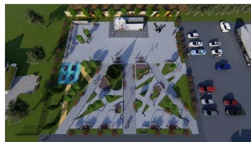
Проект благоустройства парка в п. Есаульский, реализация запланирована на 2024 год