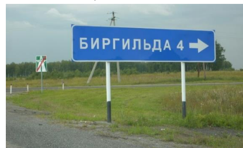
Въезд в п. Биргильда

Средства направлены в 14 муниципалитетов, в число которых вошел и Сосновский район. В губернаторский проект вошла дорога от М5 до п. Биргильда.