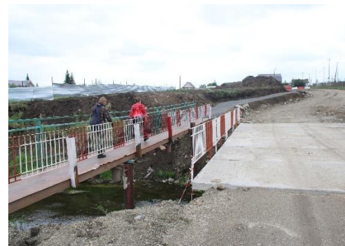
Новый мост в п. Есаульский

В д. Заварухино и в п. Есаульский началось строительство мостов. Завершить их строительство запланировано до 30 октября этого года.