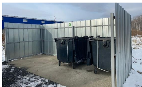
Новая контейнерная площадка в с. Кременкуль

1 627 000 рублей, выделенных району на мероприятия по нацпроекту «Экология», направлены на обеспечение жилого фонда контейнерными площадками. С июля по октябрь будут построены площадки, отвечающие современным требованиям в Краснополяском, Вознесенском и Мирненском поселениях.