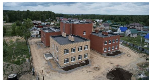
Строющийся детский сад в п. Малиновка

Еще одним направлением нацпроекта «Демография» является выплата единовременного пособия при рождении ребенка. На конец июня управление социальной защиты населения перевело на счета молодых мам 2 394 690 рублей за рождение 381 малыша.