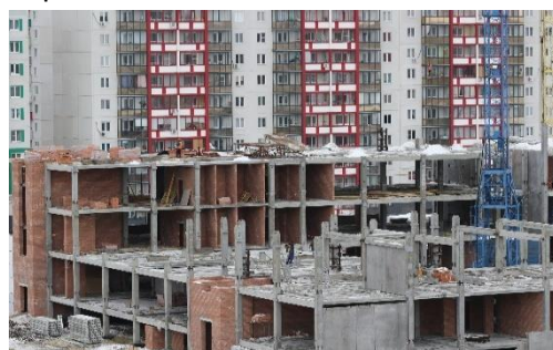
Строительство школы в мкр. Вишнёвая горка

оборудованием средних школ в Красном поле, Саккулово, Теченском, Саргазах и Полетаево.