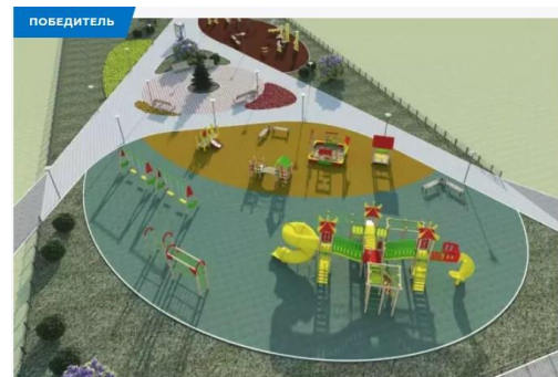
Проект сквера отдыха в п. Теченский, реализуемый в 2023г.

Наиболее высокий процент готовности сегодня в п. Теченский. Сквер отдыха завершен на 83%. Спортивная площадка получила ограждение, рабочие устанавливают тренажеры.