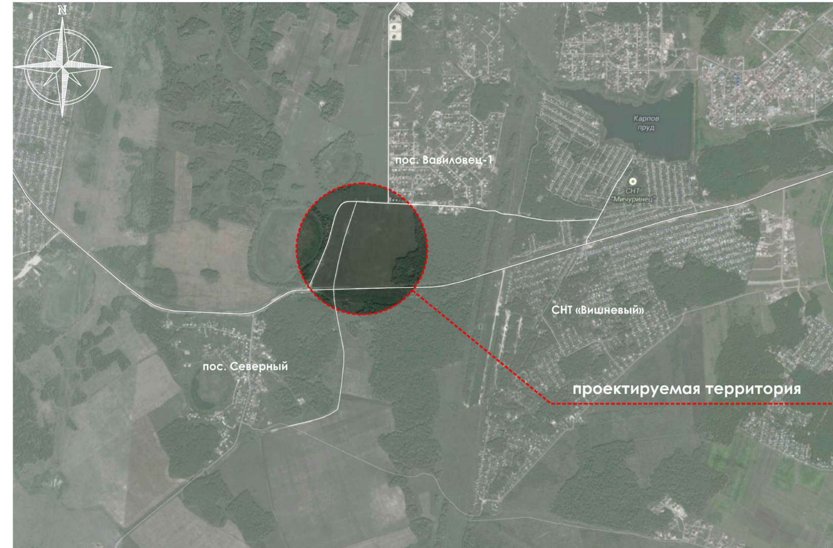
Ситуационная схема размещения проектируемой территории