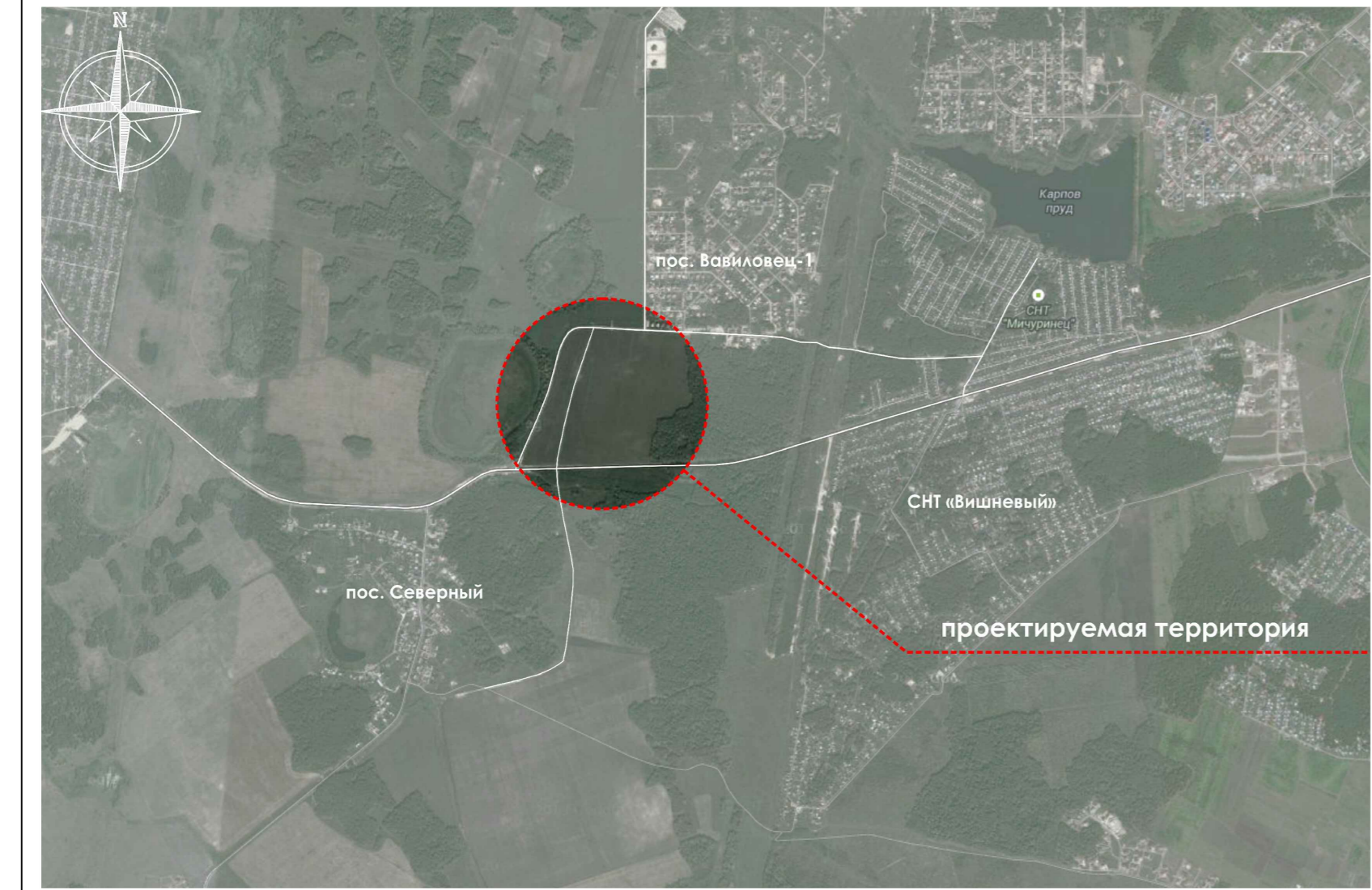
Ситуационная схема размещения проектируемой территории