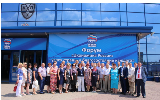
Часть депутатов входила в организационный комитет по организации и проведению предварительного общенародного голосования (праймериз).

Одно из приоритетных направлений работы фракции - это участие в партийных проектах.